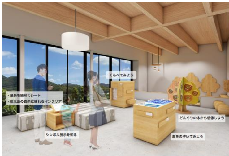
ソファでゆっくりしつつ展示と触れ合い、島についての理解を深める