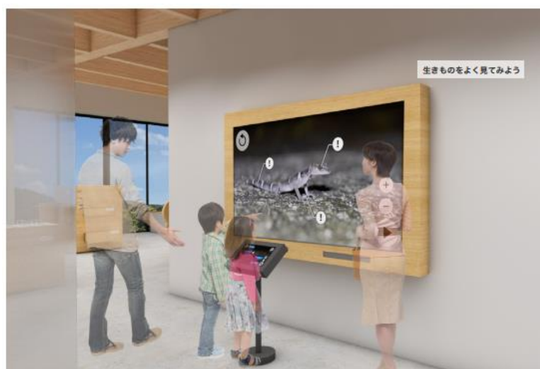
徳之島の生きものを映像でよく見て魅力を体感してもらおう