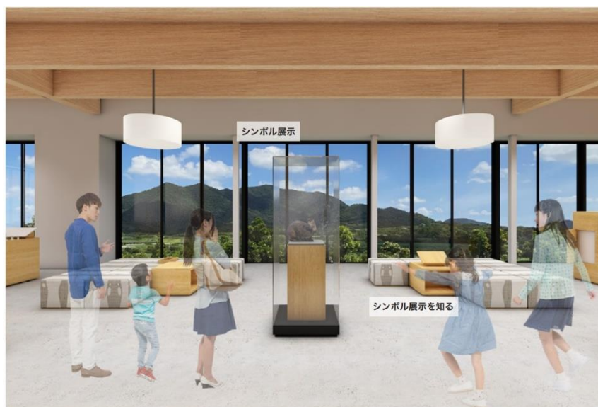
眺望を背景に、徳之島らしい生きもののシンボリックな展示

その他、生きものの比較コンテンツ、どんぐりから学ぶ季節にちなんだ生きものの生態紹介、小さな生きものを顕微鏡で観察するコンテンツなど、多数の展示を用意。